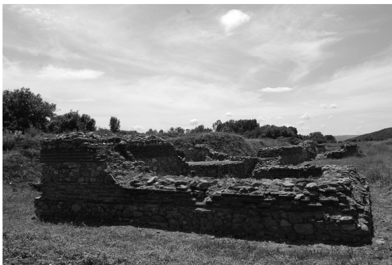
Римско утврђење Тимасит Минус – Равна