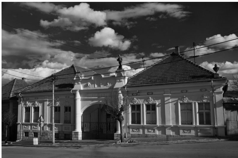
Завичајни музеј Књажевац

Самостална установа Музеј постаје одлуком донетом 30. децембра 1980. године.