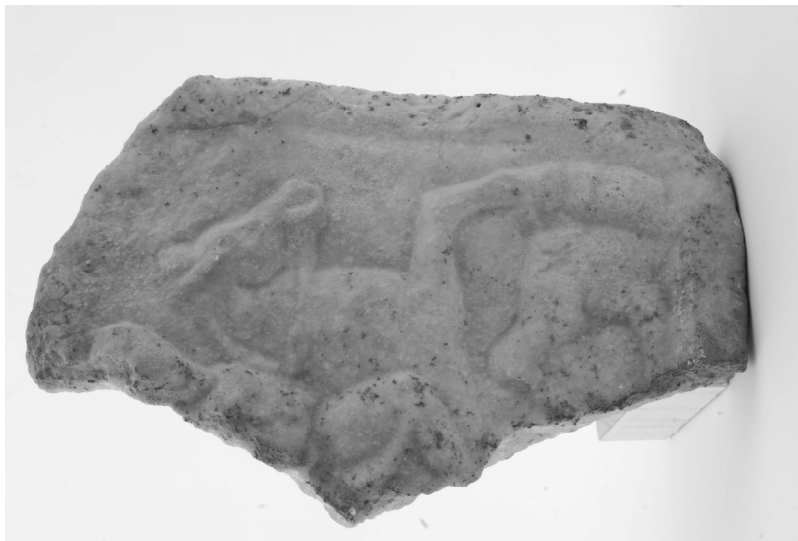
Фрагмент иконе Трачког коњаника, централна грађевина утврђења, 1984. г.

Финансијска средства 1988. године ограничила су обим истраживања на 15 дана. Екипа је радила на делу сектора Терме II (грађевина са хипокаустом, југозападно од утврђења). Грађевина је већег обима тако да није истражена у целости. На овом простору регистровани су остаци словенског насеља. Истраживања 1989. године започета су 17. септембра, а завршена су 2. октобра. Радило се на сектору централне грађевине унутар утврђења.