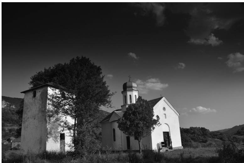
Стањинац црква Св. Кирика и Јулите из 1930. године