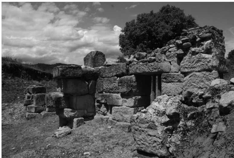
Јужна капија утврђења

Археолошка истраживања током септембра и октобра 1992. године одвијала су се на југоисточном углу утврђења (југоисточна кула) и на делу јужног бедема (кула јужне капије). Наредне године настављено је истраживање јужне капије утврђења. Том приликом откривени су остаци источне куле јужне капије која је изграђена од великих квадера пешчара. Уочен је слој гаражи који указује да је капија страдала у великом пожару.