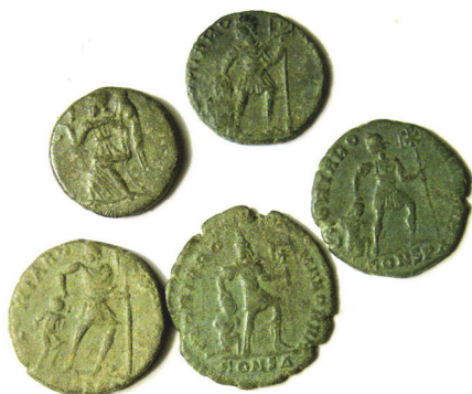
62 - 66