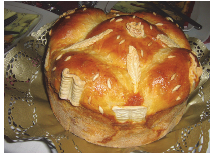
Славски колач (из породичног албума)

других села и града. Они се сада примају у кухињи или у некој другој соби где са домаћинима мало попричају, а понекад и ако треба нешто помогну у послу. Касније када већ падне мрак, гости се селе у гостинску собу, седају за сто и у ишчекивању осталих гостију, заједно са домаћинима, очекују и почетак главне вечере и славе. А када се сви оче-