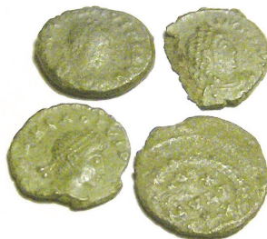
58 – 61