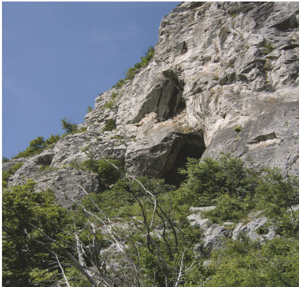
Сл.1. Фотографија локалитета