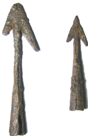
Сл.2. Врхови стрела

У подножју пећине биле су приметне две ископане рупе у сипару, једна новијег датума пречника и дубине око пола метра. Пажљивим прегледавањем избачене земље и околине пронађена су још три слабије очувана бронзана новчића (из периода понуђене расуте оставе), бронзано античко дугме, копљасти бронзани уломак неког привеска и два делимично фрагментована гвоздена врха стреле. Нису се запажали било какви трагови постојања објеката од чврстог материјала. Када се узму у обзир поменути налазци антонинијана кованих средином III века, по сведочењу налазача, највише Гордијана III (238 – 244) и године ковања најмлађих пронађених новчића у овом налазу, на овом се простору обитавало најмање један и по век. Не треба одбацити ни могућност да је пећина била централно место за живот, можда у континуитету од праисторије, што је на простору Србије више пута археолошки доказано. Преконошка пећина – Велика дупка потврђени је вишеслојни локалитет (од палеолита, преко античког периода, до средњег века) током последњих ископавања 2010. године. 32 Занимљиво је и запажање да су обе оставе пронађене поред једне масивне стене скоро правил-